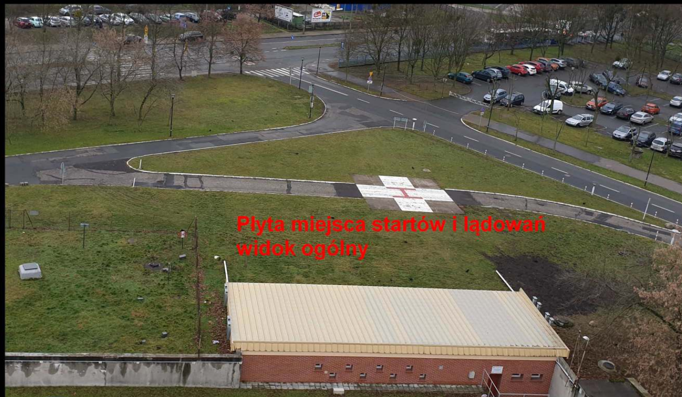
Płyta miejsca startów i lądowań widok ogólny