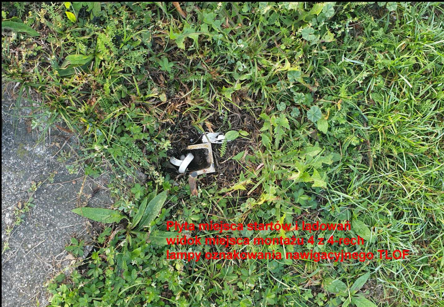
Płyta miejsca startów i lądowań widok miejsca montażu 4 z 4-rech lampy oznakowania nawigacyjnego TLOF