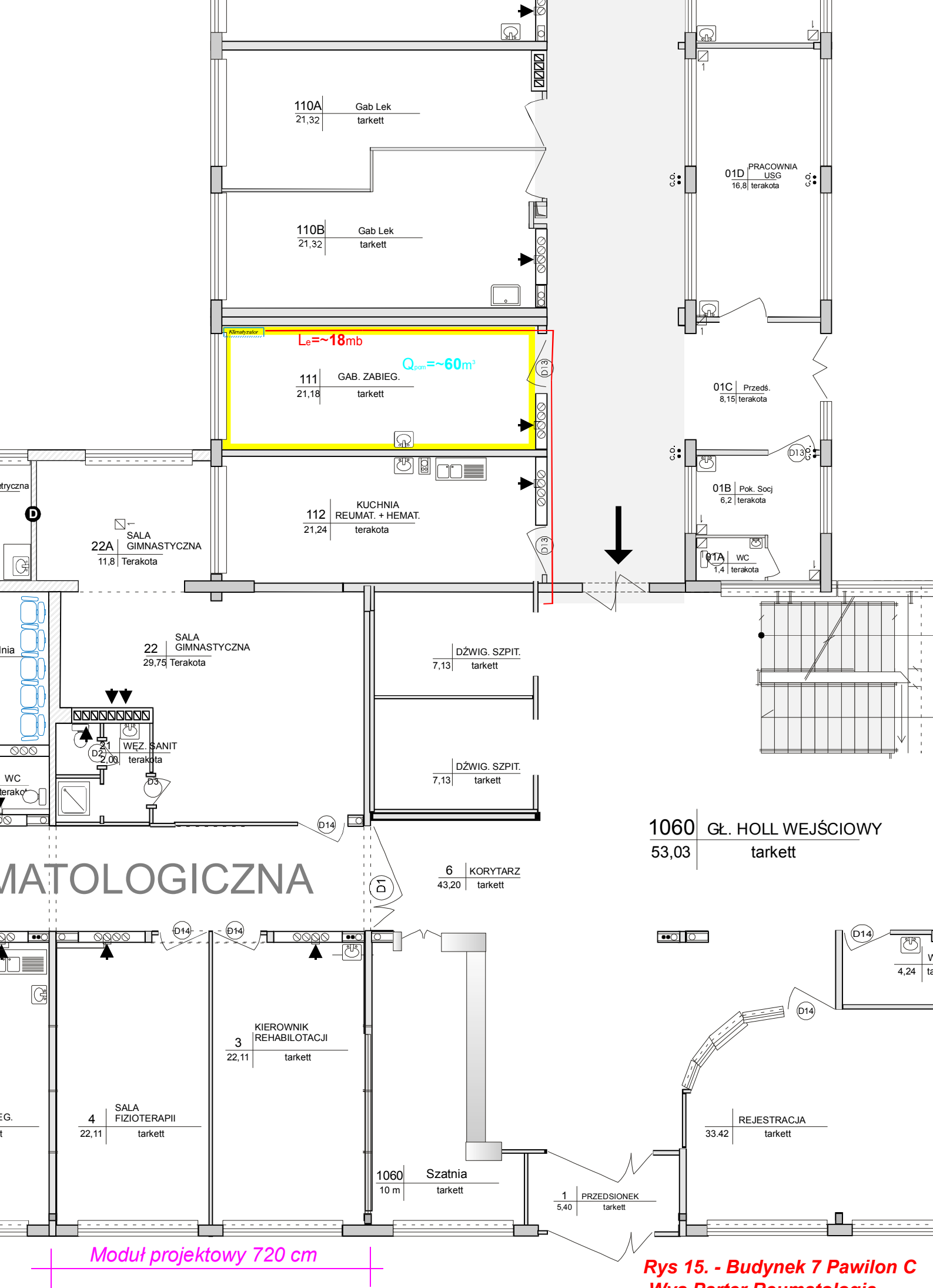
Rys 15. - Budynek 7 Pawilon C Wys Parter Reumatologia