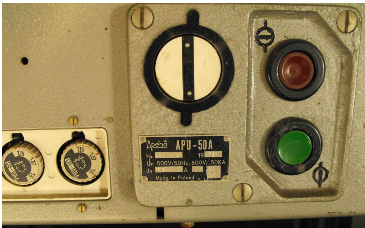
Rys 2 Zdjęcie Tabliczki znamionowej APU

IV. Termin wykonania prac: do 40 dni od dnia podpisania Umowy.